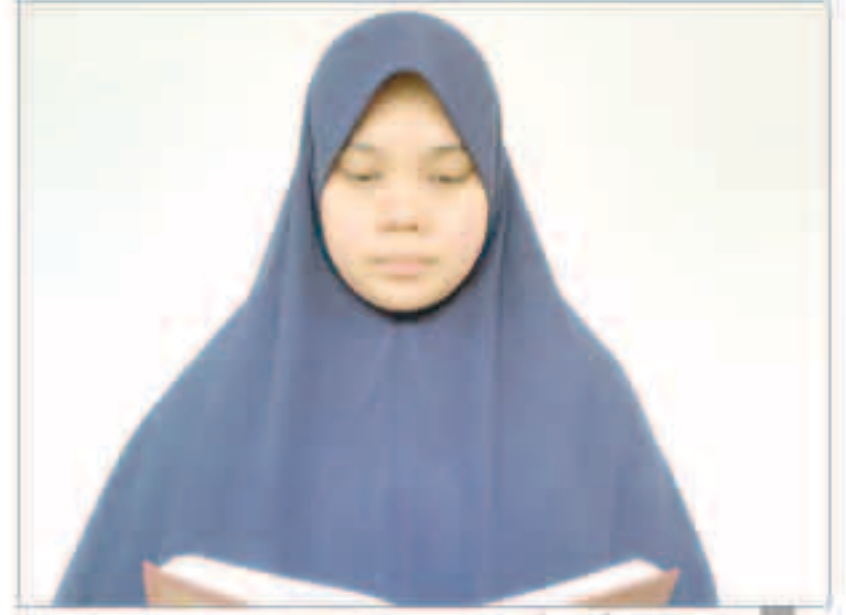
إحدى المشاركات في المسابقة