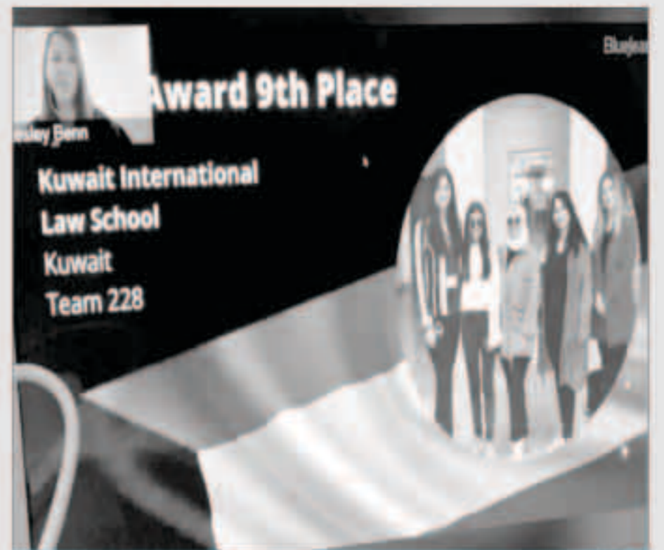
فريق الكلية المشارك

باسم كلية القانون الكويتية العالمية تتقدم إدارة التطوير الطلابي والمسابقات لطلبتها وأعضاء الهيئة التدريسية المشرفة على الفريق الممثل عن الكلية في مسابقة فيليب سي جيسوب 2020 بالشكر والتقدير وذلك وبالرغم من الظروف الاستثنائية التي يمر بها العالم أجمع، ومع توقف عجلة التعليم في مختلف الدول حول العالم، فإن هذا التوقف شمل المسابقات القانونية العربية والدولية والتي يجد فيها طلبة القانون فرصة لسفك مواهبهم القانونية والتواصل مع زملائهم من العديد من الجامعات العربية والعالمية، ومن هذه المسابقات مسابقة فيليب سي جيسوب للقانون الدولي والتي تشارك بها الكلية بنخبة من طلبة الذين يتنافسون مع طلبة من جامعات عالمية عريقة في تقديم مرفعات شفوية ومذكرات خطية وينتقلون للتدريب القانوني على أيدي عدد من أعضاء هيئة التدريس في الكلية من ذوي الخبرة في مجال القانون الدولي. أما بالنسبة لمسابقة هذا العام، فقد خضعت لظروف استثنائية بعد انتشار فيروس كوفيد-19 مما أدى إلى تعليق المرافعات