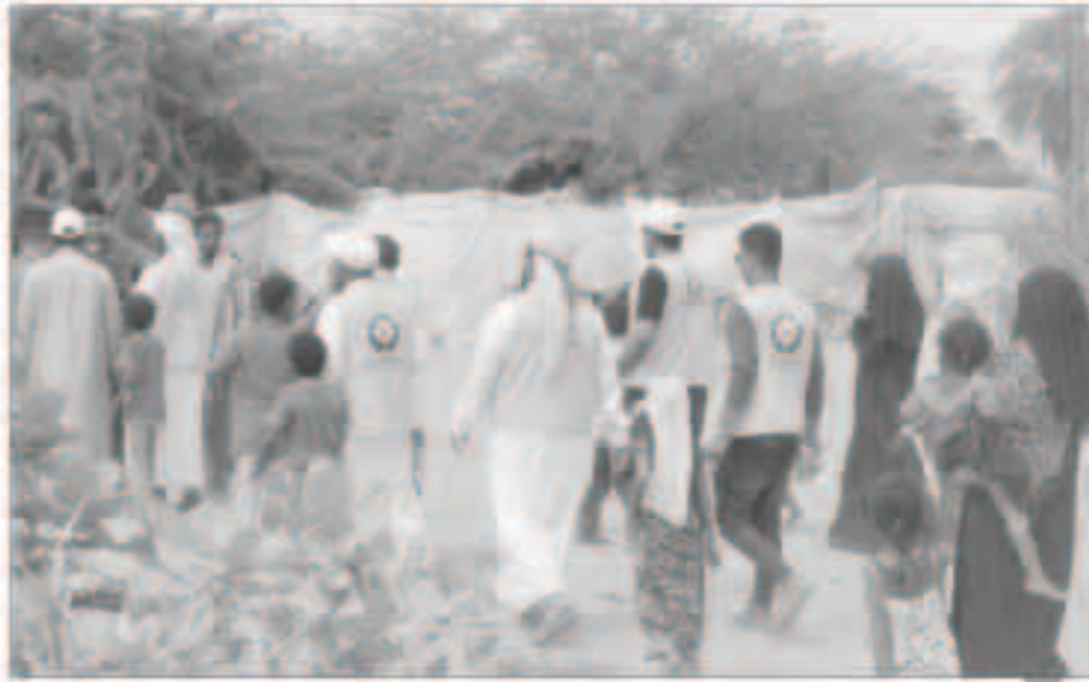
صورة أرشيفية من إغاثة ومساعدات سابقة