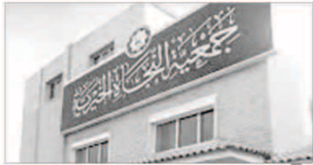
جمعية النجاة الخيرية

أن مساعدتهم أمر ضروري على كل مسلم مقتدر مصداقاً لقول الرسول الكريم محمد صلى الله عليه وسلم: ( مثل المؤمن في توادهم وتراحمهم وتعاطفهم كمثل الجسد الواحد، إذا اشتكى منه عضو تداعى له سائر الأعضاء بالسهر والحمى ). ودعا الشقران أهل الخير وأصحاب الأيدي البيضاء وذوي القلوب الرحيمة إلى دعم أعمال وأنشطة ومشاريع النجاة الخيرية لمواصلة سيرتها الناجحة بإذن الله في العمل الخيري والإنساني الذي يتميز به أبناء الكويت ما جعلها مركزاً للعمل الإنساني لافتاً أنه يمكن المساهمة عبر حسابات النجاة الخيرية عبر شتى وسائل التواصل أو التواصل مع مركز الاتصال 1800082.