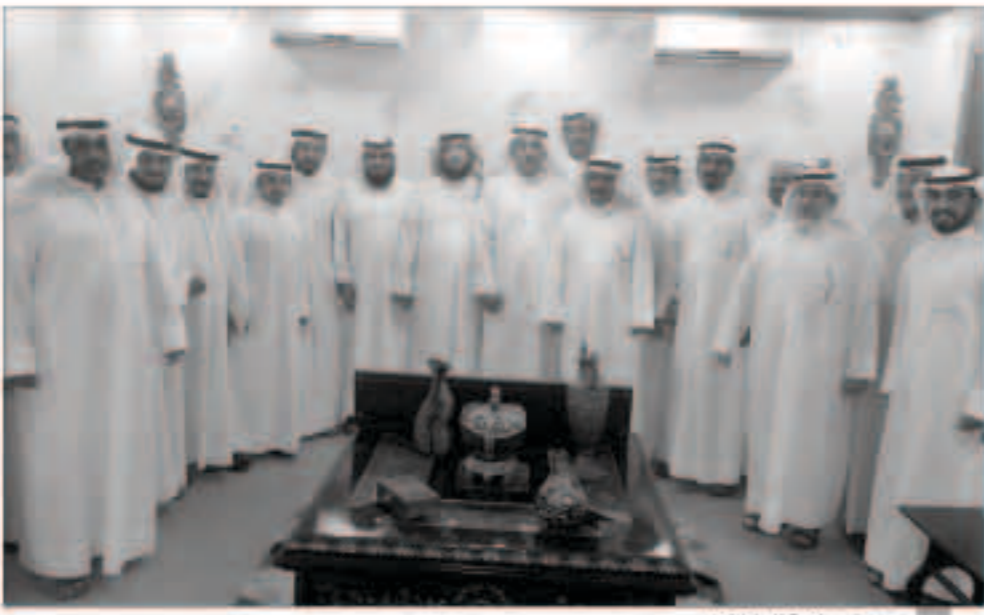
صورة جماعية للمشاركين