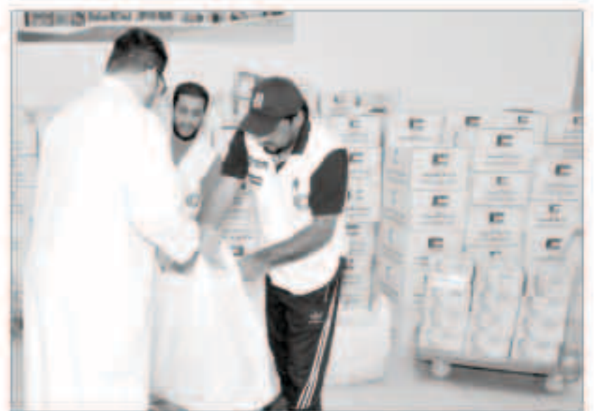
جانب من توزيع المساعدات

■ الجمالي: الشعب الكويتي جبل على فعل الخير والتبرع والتطوع للمحتاجين