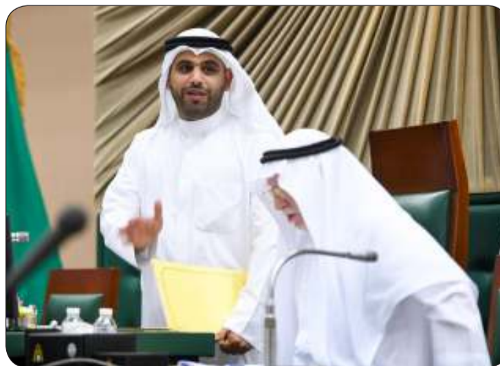
المحري خلال ترؤسه الجلسة