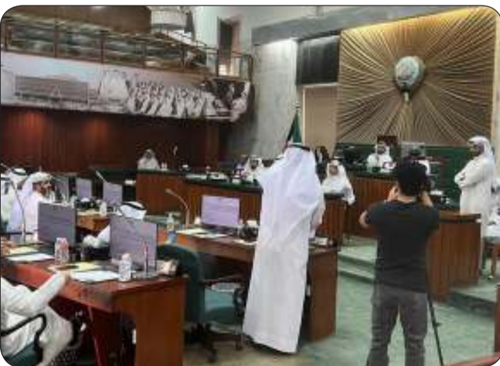
جانب من الجلسة