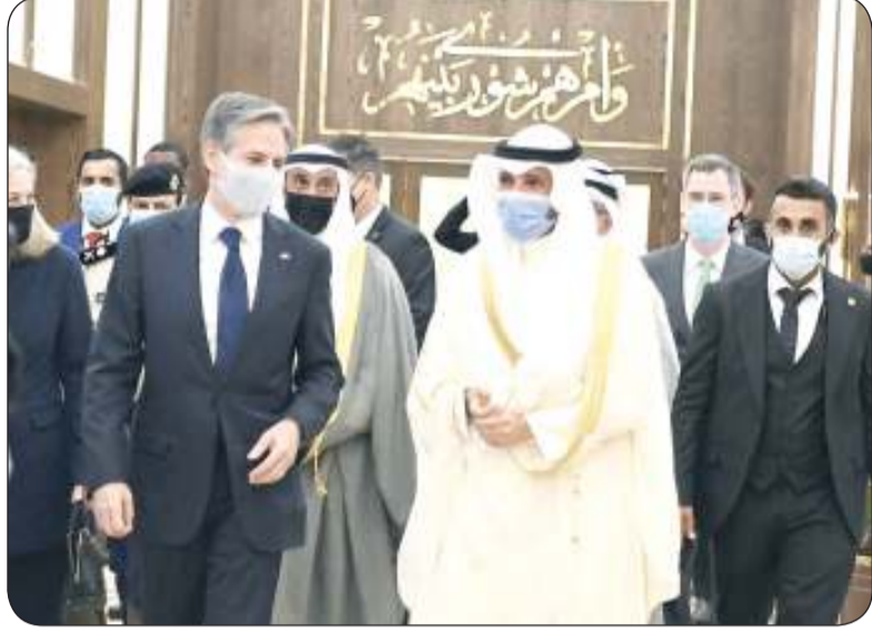
رئيس المجلس يصطحب وزير الخارجية الأمريكي في جولة داخل المجلس