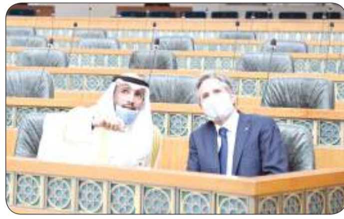
من مقاعد قاعة عبدالله السالم ونظرة إلى المستقبل

استقبل رئيس مجلس الأمة مرزوق علي الغانم أمس الخميس وزير الخارجية الأمريكي أنتوني بليكن الذي يقوم بزيارة رسمية لدولة الكويت. وذكرت شبكة "الدستور" الاخبارية في بيان ان اللقاء تناول علاقات التعاون والصداقة بين دولة الكويت والولايات المتحدة الأمريكية وسبل تعزيزها وأخذها إلى آفاق أرحب إضافة إلى بحث آخر مستجدات الأوضاع في المنطقة. حضر اللقاء النائب أحمد الحمد وسفيرة الولايات المتحدة الأمريكية لدى دولة الكويت أليسا رومانوسكي. وكان الغانم وبليكن قد قاما بجولة في مجلس الأمة حيث اطلع الوزير على قاعة عبدالله السالم واستمع إلى شرح حول آلية عمل الجلسات.