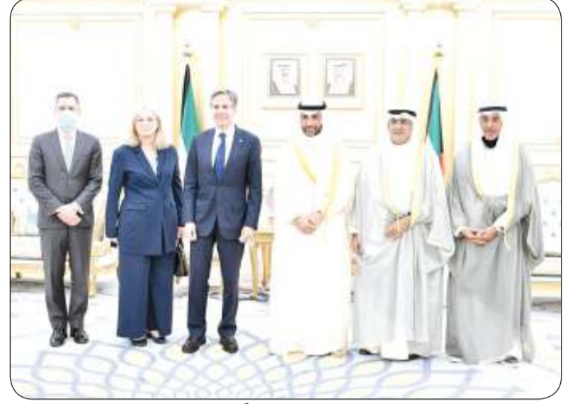
الغانم مستقبلاً بليكن

الغانم هنا نظيرته في جمهورية البيرو بالعيد الوطني لبلدها بعث رئيس مجلس الأمة مرزوق الغانم أمس ببرقية تهنئة إلى رئيسة مجلس الجمهورية في جمهورية البيرو، ميرنا إسثير فاسكيوز تشوكيلين، وذلك بمناسبة العيد الوطني لبلدها.