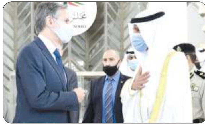
الغانم يشكر بليكن على زيارته لمجلس الأمة

الغانم هنا نظيرته في جمهورية البيرو بالعيد الوطني لبلدها بعث رئيس مجلس الأمة مرزوق الغانم أمس ببرقية تهنئة إلى رئيسة مجلس الجمهورية في جمهورية البيرو، ميرنا إسثير فاسكيوز تشوكيلين، وذلك بمناسبة العيد الوطني لبلدها.