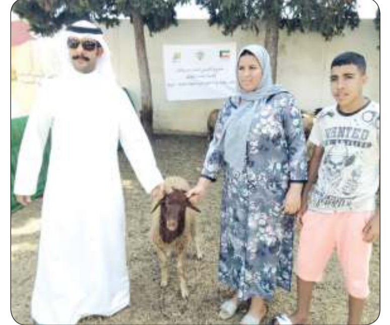
سفارة الكويت بالمغرب تنفذ مشروع توزيع الأضاحي لأسر الأيتام والأرامل

العون: الجمعية تحرص على إقامة هذه الشعيرة الإسلامية العظيمة