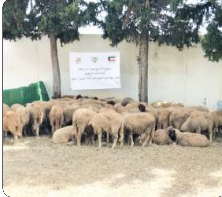
عملية توزيع الأضاحي شملت آلاف الأسر من مختلف أنحاء المملكة