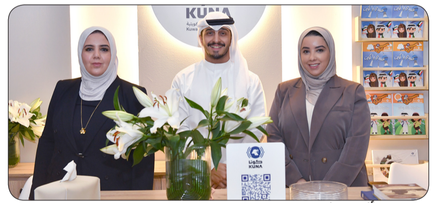
كونا أثناء مشاركتها في المعرض التابع للملتقى الاعلامي العربي

شاركت «كونا» أمس الإثنين في الملتقى الاعلامي العربي بدورته الـ 19 بمجموعة من إصداراتها المتنوعة حول الكويت في مجالات الثقافة والسياسة والإعلام باللغتين العربية والإنجليزية. وتقوم «كونا» من خلال جناحها بالملتقى بالتعريف حول دورها وخدماتها الإخبارية واستخدامها صحافة الذكاء الاصطناعي كما يقدم جناح «كونا» العديد من الإصدارات منها «الكويت في ذاكرة الأيام» و«الدليل اللغوي المبسط للاعلاميين» و«الكويت دولة الدستور» و«عدسة كونا» ومجلة «كونا الصغير». يذكر أن الملتقى الاعلامي العربي الـ 19 انطلق أمس الأول الأحد ويستمر حتى اليوم الثلاثاء حيث يضم عدد من الجلسات الحوارية بمواضيع متنوعة وبمشاركة اعلامية عربية واسعة.