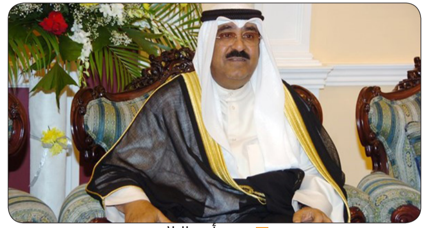
سمو أمير البلاد

بعث سمو أمير البلاد الشيخ مشعل الأحمد ببرقية تعزية إلى الرئيس لوييس إيناسيو لولا دا سيلفا رئيس جمهورية البرازيل الاتحادية الصديقة عبر فيها سموه عن خالص تعازيه وصادق مواساته بضحايا السيول والأمطار الغزيرة التي اجتاحت ولاية «ريو غراندي دو سول» جنوبي البرازيل وأسفرت عن سقوط العديد من الضحايا والمصابين وتدمير للممتلكات والمرافق العامة. راجيا سموه للمصابين سرعة الشفاء والعافية وأن يتمكن المسؤولون في البلد الصديق من احتواء وتجاوز آثار هذه الكارثة الطبيعية. كما بعث سمو الشيخ محمد الصباح رئيس مجلس الوزراء ببرقية تعزية مماثلة.