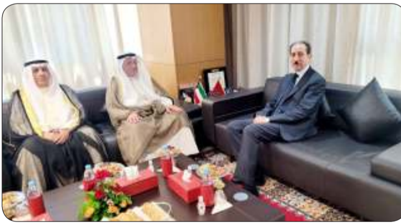
■ عادل بورسلي خلال زيارته المغرب

واعرب في هذا السياق عن الرغبة في تبادل الخبرات والتعاون بين البلدين الشقيقين في المجالات القضائية والقانونية وكذلك تعزيز الجهود لاسيما في مجال مكافحة الجريمة بكل اصنافها. ولفت الى ان اللقاء شكل ايضا مناسبة للاطلاع على الاجتهادات القضائية في البلدين بالمسائل ذات الاهتمام المشترك.