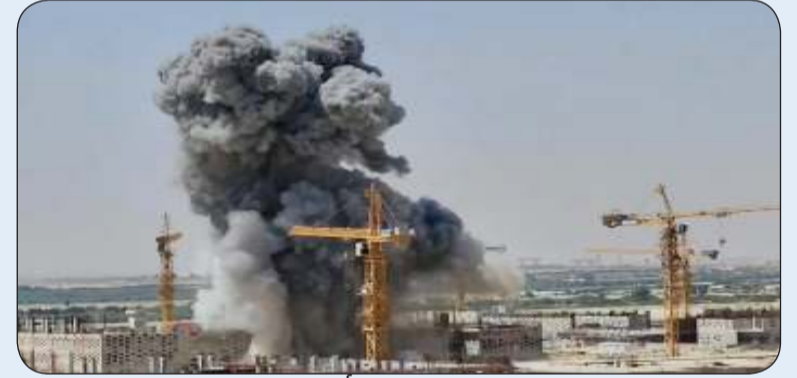
■ تفجير القنبلة بلا أضرار جانبية

التخلص من المتفجرات لمعاينة الموقع وتبين أنها قنبلة غير متفجرة تكون مخلفات عسكرية الغاشم ثم قامت باتخاذ كافة الإجراءات والتدابير الوقائية اللازمة للتخلص من القنبلة بنجاح دون وقوع أي أضرار جانبية من جراء التفجير. ودعت الإخوة المواطنين والمقيمين الكرام من مرتادي البر وأصحاب المخيمات إلى أخذ الحيطة والحذر عند التجول في المناطق الصحراوية وعدم