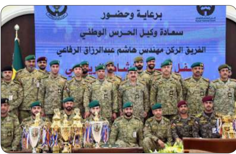
■ صورة جماعية

أكد وكيل الحرس الوطني الفريق الركن مهندس هاشم الرفاعي أن قيادة الحرس الوطني تولي اهتماما كبيرا بالأنشطة الرياضية ورفع مستوى اللياقة البدنية لجميع المنتسبين. وخلال رعايته حفل ختام النشاط الرياضي للموسم التدريبي "2023-2024" والذي أقامه فرع الاتحاد الرياضي في نادي ضباط الحرس الوطني بحضور كبار القادة والضباط، نقل الوكيل الرفاعي للفرق الرياضية تهنئة وتقدير رئيس الحرس الوطني سمو الشيخ العلي ونائب رئيس الحرس الوطني الشيخ فيصل النواف على النتائج المشرفة التي حققتها الفرق الرياضية خلال الموسم التدريبي على مستوى دوري الوزارات والهيئات والمؤسسات الحكومية، والتي تضاف إلى السجل الرياضي المتميز للحرس الوطني.