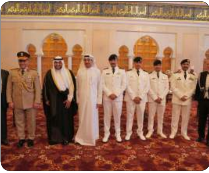
■ صورة جماعية