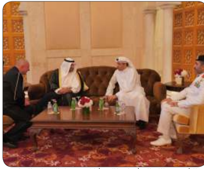
■ الشيخ عبدالله المشعل خلال مشاركته بحفل السفارة البولندية

حضر الحفل أمر سلاح الدفاع الجوي اللواء الركن خالد درج سعد وعدد من الضباط الكويتيين الخريجين من الأكاديمية البحرية البولندية.