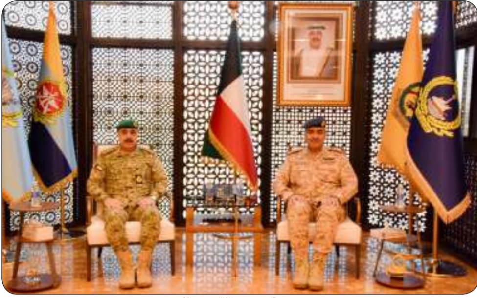
■ جانب من الاستقبال

استقبل رئيس الأركان العامة للجيش الفريق الركن طيار بندر سالم المزين، بمكتبه صباح أمس وكيل الحرس الوطني الفريق الركن مهندس هاشم عبدالرزاق الرفاعي. حيث تم خلال اللقاء تبادل الأحاديث الودية ومناقشة أهم الأمور والمواضيع ذات الاهتمام المشترك، لا سيما المتعلقة بالجوانب العسكرية والمضي قدماً في تعزيز أوجه التعاون والعمل الجماعي المشترك بين مختلف القطاعات العسكرية في البلاد. حضر اللقاء رئيس هيئة التسليح والتجهيز اللواء الركن بحري فيصل خليفة مبارك و معاون العمليات والتدريب في الحرس الوطني اللواء الركن دكتور فالح شجاع فالح.