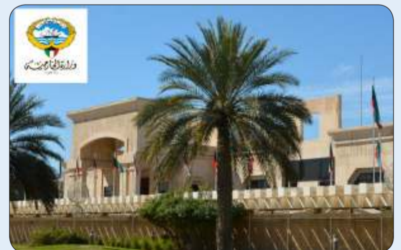
■ وزارة الخارجية

على قوافل المساعدات التابعة للأردن أثناء توجهها لغزة