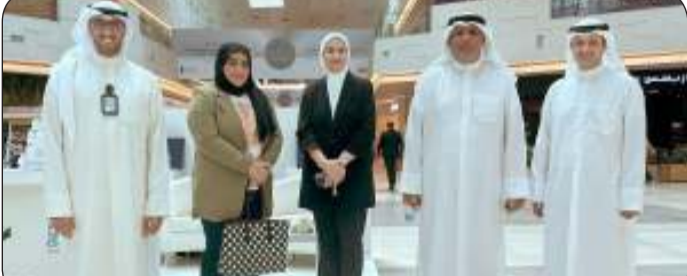
■ الهيئة العامة للقوى العاملة احتفلت باليوم العالمي للعمال في مجمع الأفنيوز

لعمله وقبوله به انسجاماً مع التزامات دولة الكويت التي نص عليها دستور البلاد في المادة «41» بأن «لكل كويتي الحق في العمل وفي اختيار نوعه، والعمل واجب على كل مواطن تقتضيه الكرامة ويستوجبه الخير العام، وتقوم الدولة على توفيره للمواطنين وعلى عدالة شروطه». وبيّنت أن دولة الكويت التزمت بما جاء في الإعلان العالمي لحقوق الإنسان في المادة «23»، والعهد الدولي الخاص بالحقوق المدنية والسياسية في المادة «8»، موضحة أن دولة الكويت صادقت على 19 اتفاقية من 8 اتفاقيات أساسية. وذكرت أن حكومة دولة الكويت أبرمت 21 مذكرة تفاهم ثنائية مع عدد من الدول لنقل الأيدي العاملة سواء كانت للعمال في القطاع الأهلي أو العمالة المنزلية بهدف