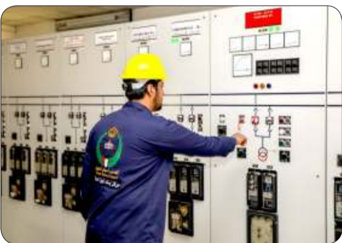
■ تمرين إسناد

من الجهات الموقع بينها وبين الحرس الوطني بروتوكولات تعاون. وأشاد اللواء نايف بقدرته الفرق المدربة في مركز إسناد أجهزة الدولة على تنفيذ المهام الموكلة إليها بأسرع وقت وباحترافية عالية والتزامها بتطبيق إجراءات الأمن والسلامة لضمان نجاح عمليات التدريب وتأنيق الجاهزية العالية في تطبيق المهام الحيوية الموكلة إلى المركز.