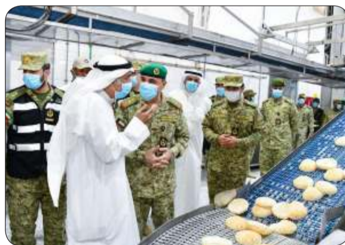
■ التمرين حقق أهدافه كاملة

سالم العلي الصباح رئيس الحرس الوطني ونائب رئيس الحرس الوطني الشيخ فيصل نواف الأحمد الصباح من جانبه قال المعاون للإسناد الإداري بالحرس اللواء مهندس عصام نايف وفق البيان أن التمرين عقد على مدى ثلاثة أيام ونفذه مركز إسناد أجهزة الدولة بالتعاون مع وحدات المعاون للإسناد الإداري وتم خلاله تقديم الدعم عبر الفرق المدربة لعدد