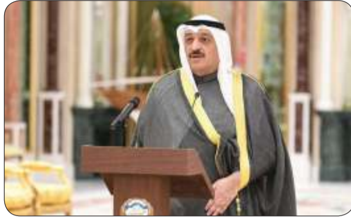
■ وزير الصحة

الجانب العماني تعتبر خطوة مهمة في ظل حرص الوزارة على تنفيذ مشروع تطوير قدرات العنصر البشري ضمن برنامج عمل الحكومة. وأضافت أن أهمية هذه المذكرة تكمن في ضوء استعدادات إدارة الخدمات التمريضية وبدعم ومتابعة من وزير الصحة الدكتور أحمد العوضي للتطوير والإشراف على البرامج التدريبية وإعداد وعقد البرامج التدريبية المتخصصة. وأوضحت أن الهدف من ذلك تدريب أكبر عدد ممكن من الكوادر التمريضية في مختلف المجالات لتنمية المهارات السريرية والفنية وتعزيز مهارات التواصل الصحي ومهارات الإدارة والقيادة إذ ستتولى الفرق المدربة التي حضرت