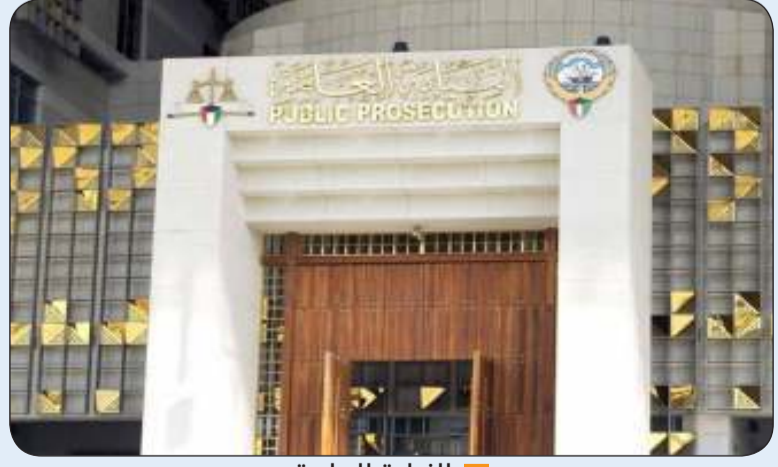
■ النيابة العامة

أمرت النيابة العامة الكويتية بحجز مواطن لاتهامه بالانضمام إلى تنظيم محظور والتخطيط لأعمال إرهابية داخل البلاد إذ قام بنشر تسجيلات مرئية ومسموعة لأعمال ذلك التنظيم وأخباره في مواقع التواصل الاجتماعي تأييدا له كما تعلم صناعة التفجيرات وحرض متهمين آخرين على تعلمها بهدف تفجير