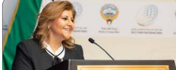
■ الشيخة جواهر إبراهيم الدعيج

تسهيل الإجراءات المتعلقة في نقل الأيدي العاملة. وأشارت الشيخة جواهر الصباح إلى سعي حكومة الكويت إلى تذليل كافة المشاكل والتحديات التي تعترض أي مرحلة من مراحل الاستخدام وأيضاً إشراك الدول المصدرة للعمالة في تحمل مسؤوليتها في هذا الإطار. وجددت التأكيد على التزام دولة الكويت في إعمال الحق بالعمل لجميع قاطني أراضيها وذلك في حدود دستورها والتشريعات الوطنية إذ تكفل الدولة فرص العمل للمواطن الكويتي علاوة على مواثمة بيئتها التشريعية للاستقرار الوظيفي حتى لا يضطر المواطن للمغادرة والبحث عن فرص عمل بالخارج إذ بلغ عدد إجمالي القوى العاملة الوطنية لدولة الكويت 500 ألف نسمة و64% منهم من الإناث و36% من الذكور في القطاع الحكومي.