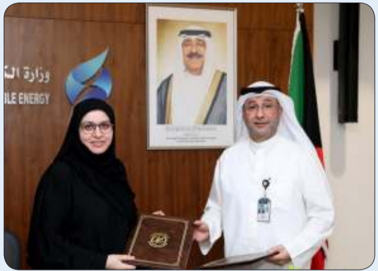
■ جانب من توقيع مذكرة التفاهم

وقعت شركة نفط الكويت أمس الأربعاء مذكرة تفاهم مع وزارة الكهرباء والماء والطاقة المتجددة تهدف إلى تنسيق الجهود والتعاون المستمر وتذليل الصعوبات فيما يخص مشروع إنتاج 1 غيغاوات كهرباء من الطاقة الشمسية. وذكرت الشركة في بيان لـ (كونا) إن المذكرة تأتي في إطار المبادرات والمشاريع التي تتضمنها إستراتيجية القطاع النفطي الكويتي للتحويل في الطاقة 2050 باعتبارها مكلفة وملتزمة بتولي تنفيذ القسم الأكبر من تلك المشاريع نظرا لريادتها في هذا المجال. وبيّنت أن المذكرة تساهم في تعزيز التفاهم والعمل المشترك بين الشركة والوزارة وتطوير التصورات اللازمة بما يضمن تحقيق التزامات الدولة التي عبر عنها سمو أمير البلاد الشيخ مشعل الأحمد الجابر الصباح حفظه الله ورعاه وأعلن عنها في مؤتمر الأطراف (كوب 27) المنعقد بمدينة شرم الشيخ المصرية في عام 2022 ومؤتمر الأطراف (كوب 28) المنعقد في إمارة دبي 2023 إذ كانت الكويت ضمن 124 دولة مشاركة وتعدت بضرورة اتخاذ التدابير المطلوبة لتصحيح مسار تغير المناخ والحد من تجاوز درجات الحرارة 1.5 درجة مئوية.