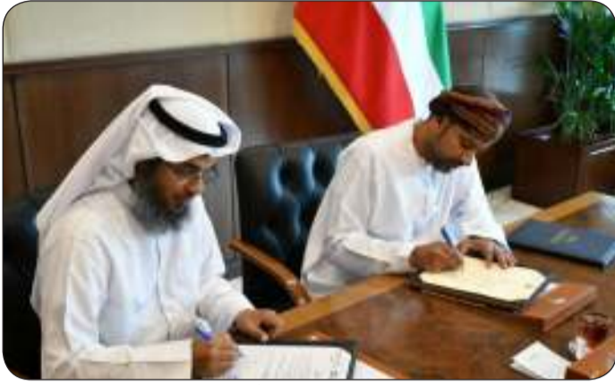
■ جانب من توقيع مذكرة التفاهم

البرامج التدريبية تدريب فرق أخرى جديدة في أماكن عملهم. وكشفت عن انطلاق أولى الدورات التدريبية التخصصية في العناية المركزة وتمتد على مدى أربعة أسابيع في قاعات التدريب بمستشفى جابر الأحمد بحضور 15 ممرضاً وممرضات لكل دورة من مختلف المستشفيات التابعة لوزارة الصحة. وبيّنت أن الدورة تركز على تدريب الكوادر التمريضية على تقديم الرعاية التخصصية للحالات الحرجة وتطوير وتنمية المهارات السريرية واستخدام التكنولوجيا الطبية المتقدمة في العناية المركزة مما ينعكس بدوره على تحسين فهم الممرضين لمبادئ الرعاية الصحية في العناية المركزة.