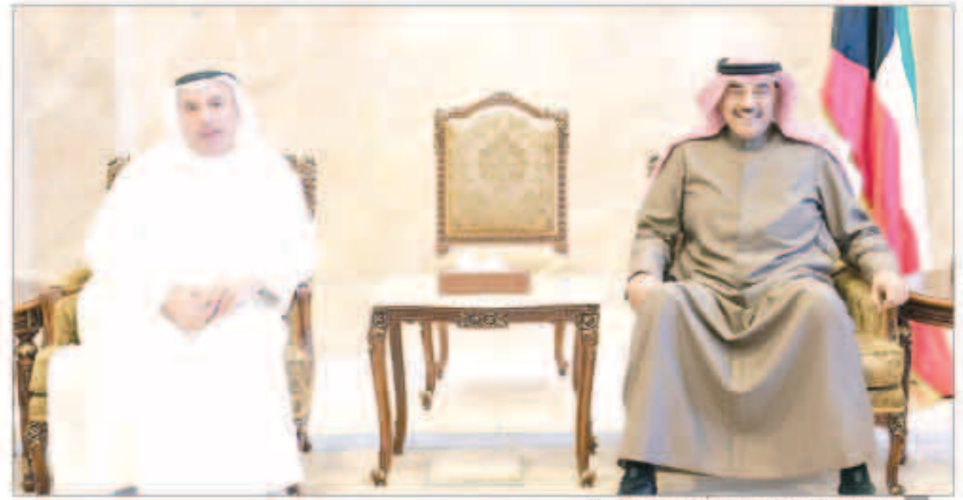
سمو رئيس مجلس الوزراء مستقبلاً رئيس ديوان المحاسبة

أكد ضرورة المحافظة على المال العام خلال اجتماعه مع عدد من الوزراء والقياديين بديوان المحاسبة