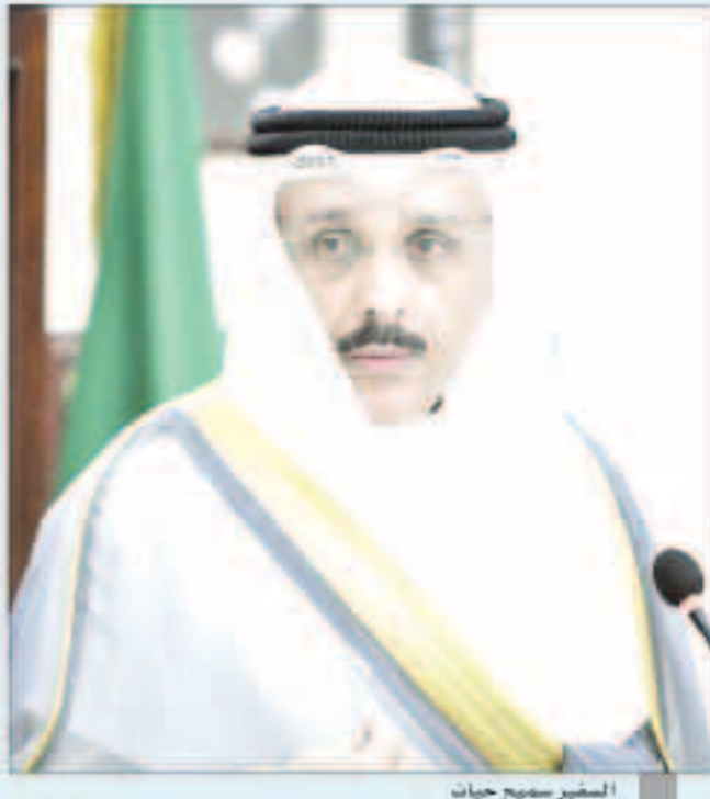
الشيخ سموه حيات

■ أنس الصالح: الكويت حريصة وبتوجيهات سامية على استكمال وتعزيز مسيرة التعاون الأمني الخليجي ■ وزراء داخلية الخليج اتفقوا على التواصل المستمر «عبر تقنية الاتصال المرئي» لتنسيق الجهود الأمنية ■ الشايح: كامل التقدير للجهود المميزة التي تقوم بها الحكومة في إدارة الأزمة والتي هي موضع اعتزاز الجميع