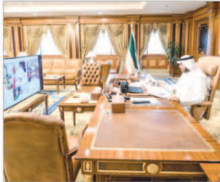
أنس الصالح خلال اجتماعه مع وزراء داخلية دول التعاون عبر الاتصال