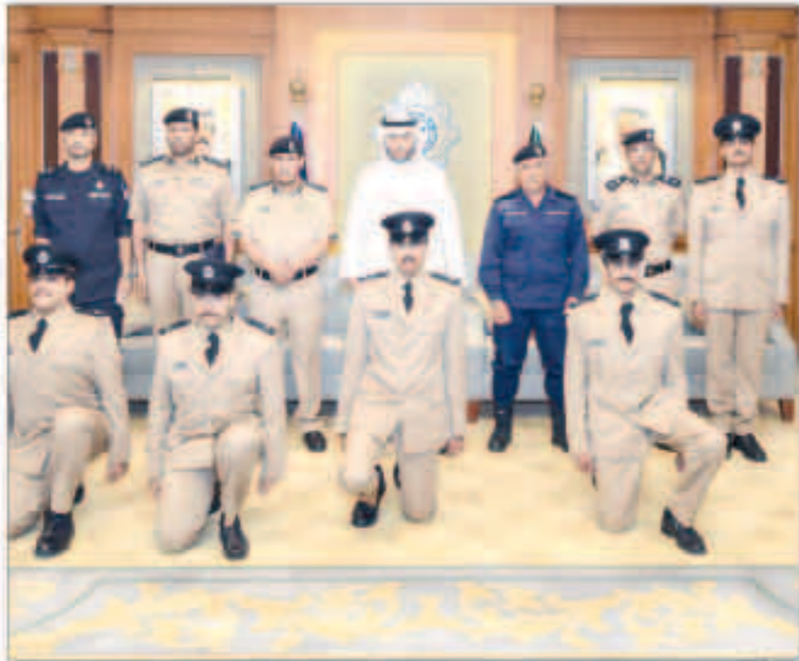
الصالح أوصى الخريجين بدعم زملائهم في مواجهة كورونا

قال الصباح إن «كل دولة في العالم لها أوضاعها الخاصة، وبالتالي تقييمها للأزمة». مشيراً إلى أن «نولا كما تقرون وتشاهدون تتوقع أن تشهد الإصابات مرحلة الذروة هذا الشهر والشهر الذي يليه. وهناك دول قررت البدء بتخفيف إجراءات التشدد، وهناك دول تتوقع أن تطول الأزمة إلى آخر الصيف». وأضاف «تبقى تداعيات الأزمة حتى بداية السنة المقبلة، إذ ما زالت تشهد منحى صاعداً في صعود الحالات». عتمة «التمكن من إيجاد نواة في القريب العاجل». من جهة أخرى عقد سمو الشيخ صباح الخالد رئيس مجلس الوزراء في مكتبه بقر الأمانة العامة لمجلس الوزراء في قصر السيف أمس لقاء مع رئيس ديوان المحاسبة فيصل الشايح وبحضور وزير الخارجية الشيخ الدكتور أحمد