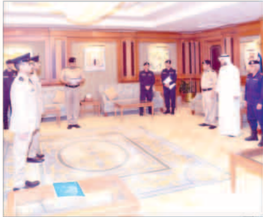
عدد من الضباط الخريجين يؤدون القسم أمام وزير الداخلية