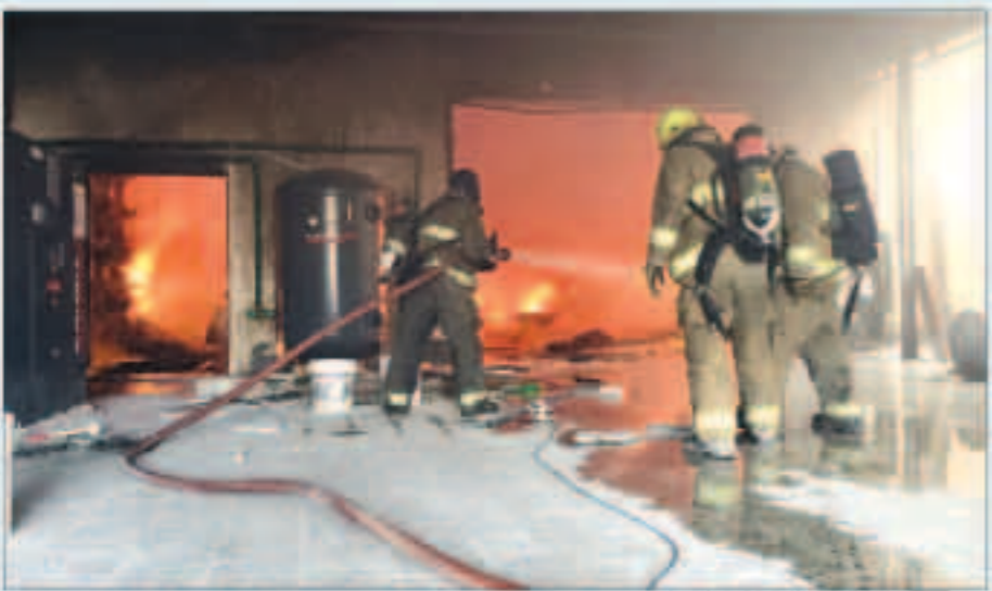
رجال الإطفاء يواصلون النار

وقالت «الإطفاء» في بيان صحفي أن فرق إطفاء الجبراء والصليبيخات والإسناد وصبحان والعارضية وحولي و كاتلة والديسة والسالمية الجنوبية توجهت إلى موقع الحادث فور تلقي غرفة عمليات الإدارة بلاغاً في الساعة 1:16 ظهراً عن وجود حريق في مصنع تقدر مساحته 1500 متر مربع تقريباً. وأضافت أنه تم توجيه الفرق للتعامل مع الحادث وتمت السيطرة عليه نحو الساعة الرابعة عصراً حيث تواجد في الموقع رجال وزارة الداخلية والطوارئ الطبية مبنية أن أول فرقة إطفاء وصلت للموقع في غضون أربع دقائق وشرع رجالها بمكافحة الحريق والسيطرة بأسرع وقت ممكن حتى لا يمتد إلى المباني المجاورة. وذكرت أنه سيتم فتح تحقيق لمعرفة الأسباب التي أدت إلى اندلاع الحريق.