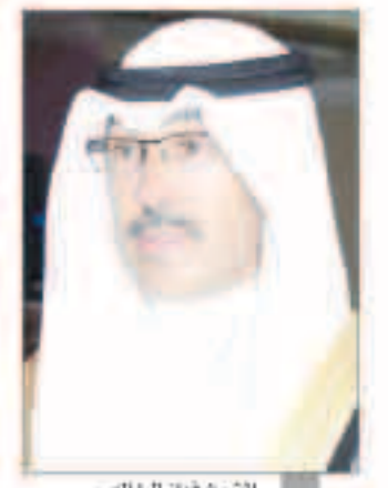
الشيخ فوزان الحامد

امن وسلامة المجتمع. وتعني محافظ الاحمدي الامن والسلمة لجميع المواطنين وللقيمين في دولة الكويت بوجه عام وفي محافظة الاحمدي على نحو خاص، مشدداً على أن صحة وسلامة الاهالي تأتي في مقدمة الاهتمامات والأولويات. من جانب آخر دعت جمعية المهندسين إلى سرعة الصدد من الآثار المترتبة على التسرب النفطي الذي شهدته المياه الإقليمية خلال اليومين الماضيين، لافتة إلى ضرورة الوقوف على سببها هذا التسرب واتخاذ الإجراءات اللازمة ضدهم وفقاً لقانون البيئة الجديد. وأعرب العتير في تصريح صحفي عن قلقه من تلوث المياه الإقليمية داعياً إلى ضرورة الإسراع في الكشف عن المسبب بهذا التسرب وتحديد مصدره ورفع الأمر إلى النيابة العامة لاتخاذ الإجراءات اللازمة.