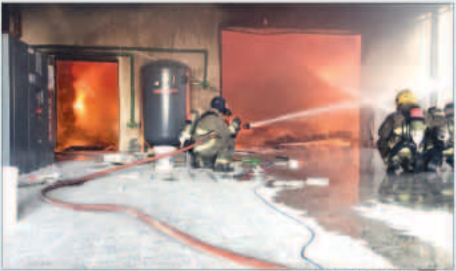
فرق مكافحة تحاصر النيران