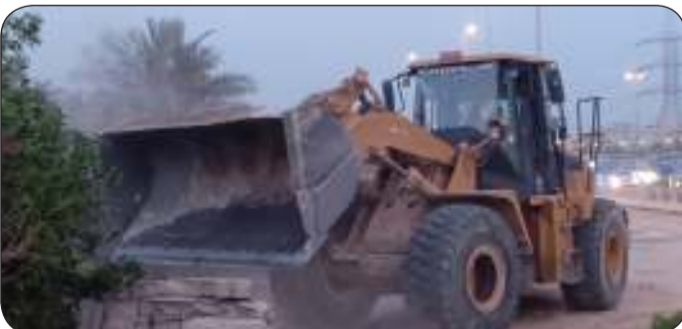
جانب من إزالة المخالفات