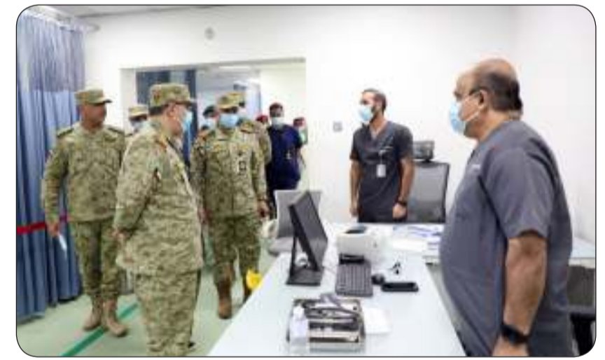
جانب من الجولة التفقدية