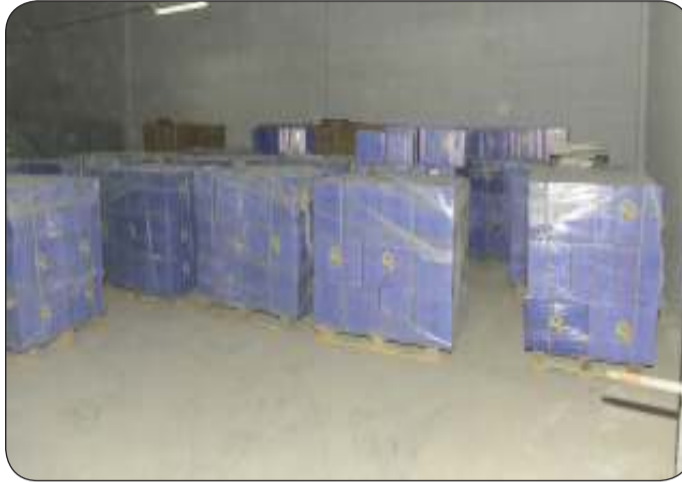
ممتلكات الكويت التي استولى عليها النظام السابق إبان الغزو العراقي