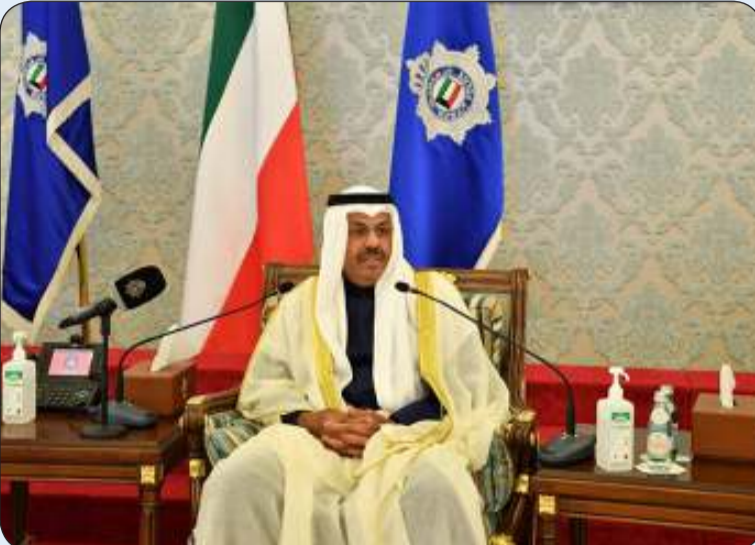
الشيخ أحمد النواف

على ما تقانوا فيه من عطاء وما قدموه من تضحيات وأمانة في أداء الواجب. وأوضح أن جهودهم وعملهم لوطنهم كان عطاء بلا حدود وأنهم تحملوا المهام الجسام التي أقيمت على عاتقهم بكل كفاءة واقتدار مؤكدا أن الكويت لا تنسى أبناءها الذين ضحوا من أجل أمن هذا الوطن واستقراره. وأعرب عن تقديره لما بذلوه من مساهمات ملموسة في مراحل تطوير وتحديث المنظومة الأمنية من خلال جميع المناصب التي تقلدوها في مختلف القطاعات الأمنية مؤكدا أنهم كانوا نموذجا للتفاني والإخلاص.