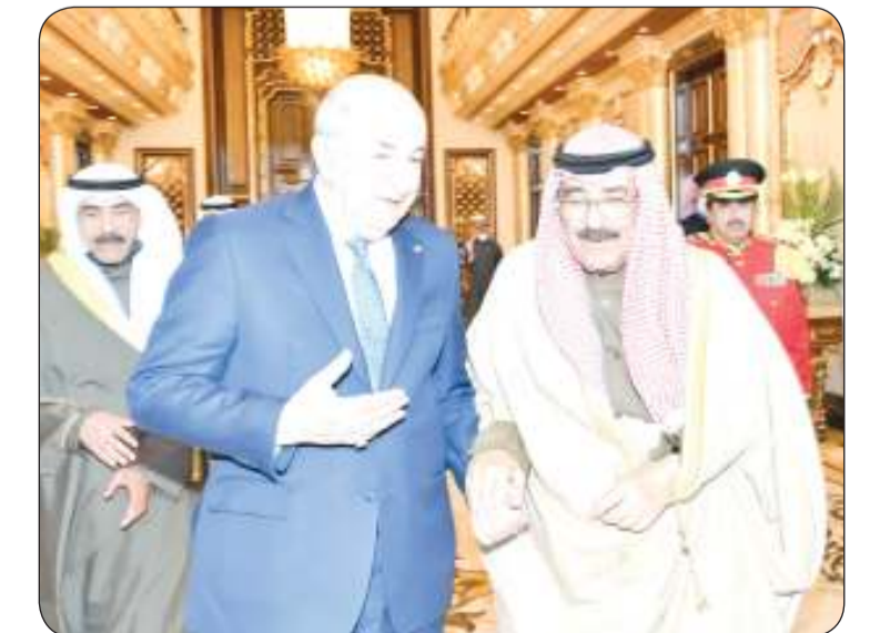
سمو ولي العهد أولم على شرف ضيف الكويت