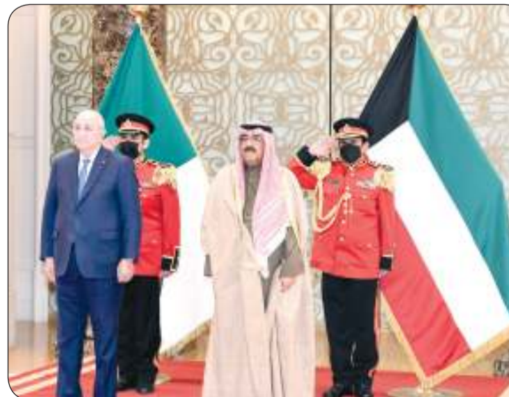
مراسم وداع الرئيس الزائر