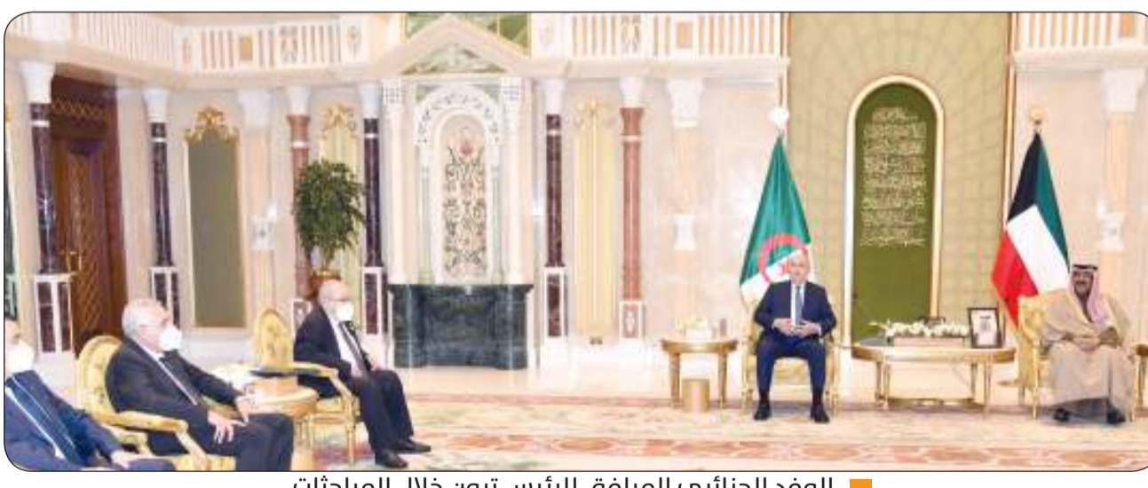
الوفد الجزائري المرافق للرئيس تبون خلال المباحثات