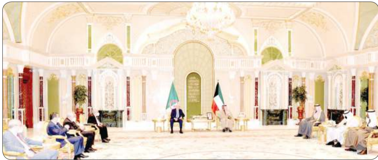
جانب من جلسة المباحثات

حضر المقابلة وزير شؤون الديوان الأميري الشيخ محمد العبدالله ورئيس الديوان الأميري الشيخ مشعل مبارك الفيصل.