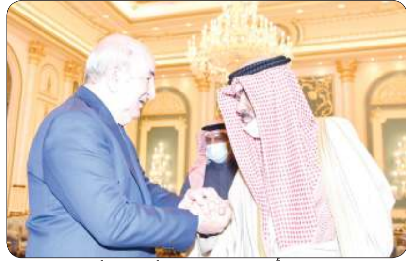
سمو أمير البلاد مستقبلا الرئيس الجزائري

استقبل سمو أمير البلاد الشيخ نواف الأحمد بدار يمامة ظهر أمس الرئيس عبدالمجيد تبون رئيس الجمهورية الجزائرية الديمقراطية الشعبية الشقيقة والوفد الرسمي المرافق له وبحضور سمو ولي العهد الشيخ مشعل الأحمد وذلك بمناسبة زيارته الرسمية للبلاد.