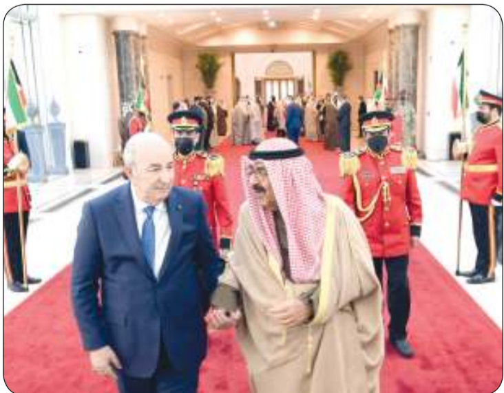
سمو ولي العهد مودعا الرئيس الجزائري في المطار