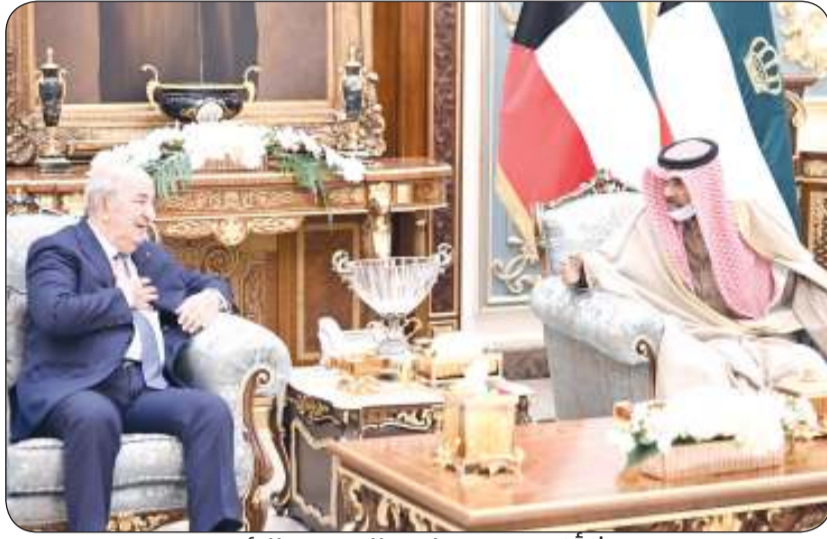
حديث أخوي بين صاحب السمو والرئيس تبون

وأقام سمو ولي العهد مأدبة غداء على شرف الرئيس عبدالمجيد تبون رئيس الجمهورية الجزائرية الديمقراطية الشعبية الشقيقة والوفد الرسمي المرافق له وذلك بمناسبة زيارته الرسمية للبلاد. وغادر الرئيس الجزائري البلاد عصر أمس الرئيس عبدالمجيد تبون رئيس الجمهورية الجزائرية الديمقراطية الشعبية الشقيقة والوفد الرسمي المرافق له بعد زيارة رسمية للبلاد التقى خلالها مع صاحب السمو. وكان على رأس مودعي الرئيس تبون على أرض المطار سمو ولي العهد الشيخ مشعل الأحمد، وسمو الشيخ صباح الخالد رئيس مجلس الوزراء وكبار المسؤولين بالدولة.