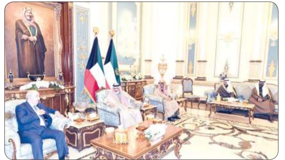
تطابق بالمواقف بين قيادتي البلدين