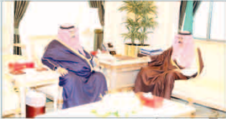
سمو نائب الأمير مستقبلاً سمو الشيخ ناصر المحمد

استقبل سمو نائب الأمير وولي العهد الشيخ نواف الأحمد بقصر صباح أمس سمو الشيخ ناصر المحمد بالإحمد. واستقبل سموه محافظ مبارك الكبير الفريق أول متقاعد أحمد عبداللطيف الرجيب.