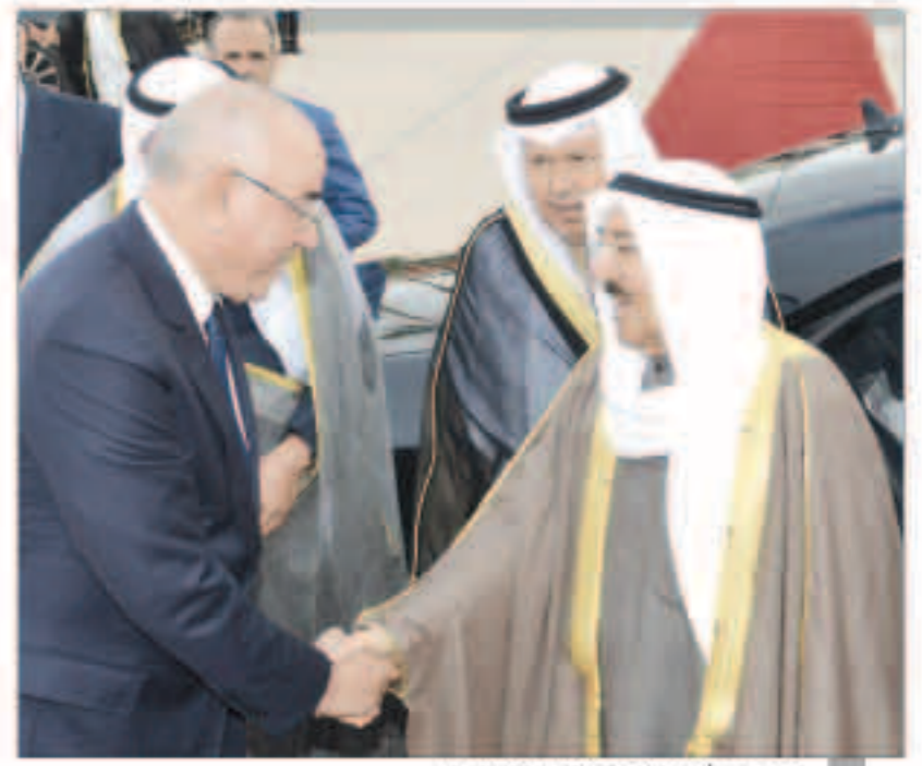
توديع سمو أمير البلاد في مطار مراكش الدولي

ويعت صاحب السمو ببرنامجاً شاملاً لزيارة سموه للمملكة المغربية الشقيقة أعرب فيها سموه عن خالص الشكر والتقدير على الحفاوة البالغة وكرم الضيافة اللتين حظي بهما سموه والوفد المرافق خلال ترؤسه وفد دولة الكويت في أعمال مؤتمر الدول الأطراف في اتفاقية الأمم المتحدة حول التغيرات المناخية في دورته 22 والتي استضافته مدينة مراكش. كما أشاد سموه بإدارة أخيه صاحب