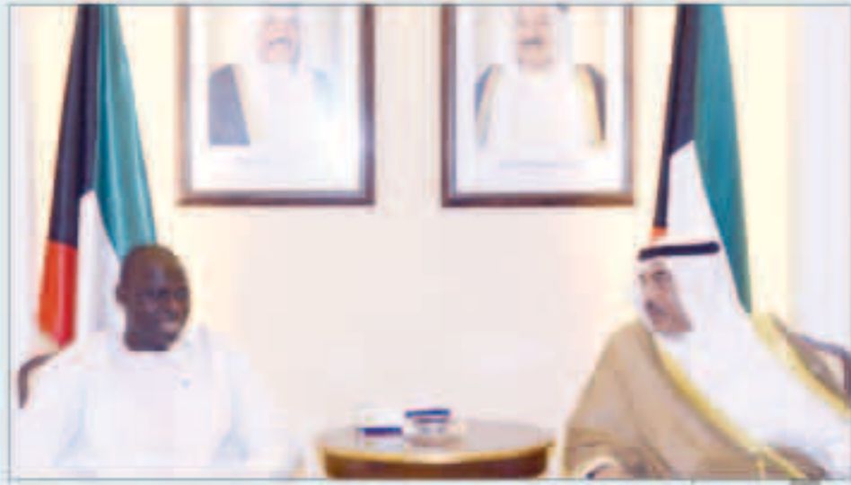
... ومستقبلاً وزير المالية الغامبي