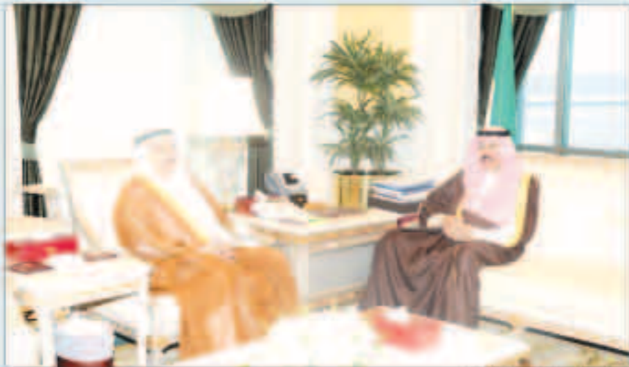
سموه مستقبلاً الرجيب

استقبل سمو نائب الأمير وولي العهد الشيخ نواف الأحمد بقصر صباح أمس سمو الشيخ ناصر المحمد بالإحمد. واستقبل سموه محافظ مبارك الكبير الفريق أول متقاعد أحمد عبداللطيف الرجيب.