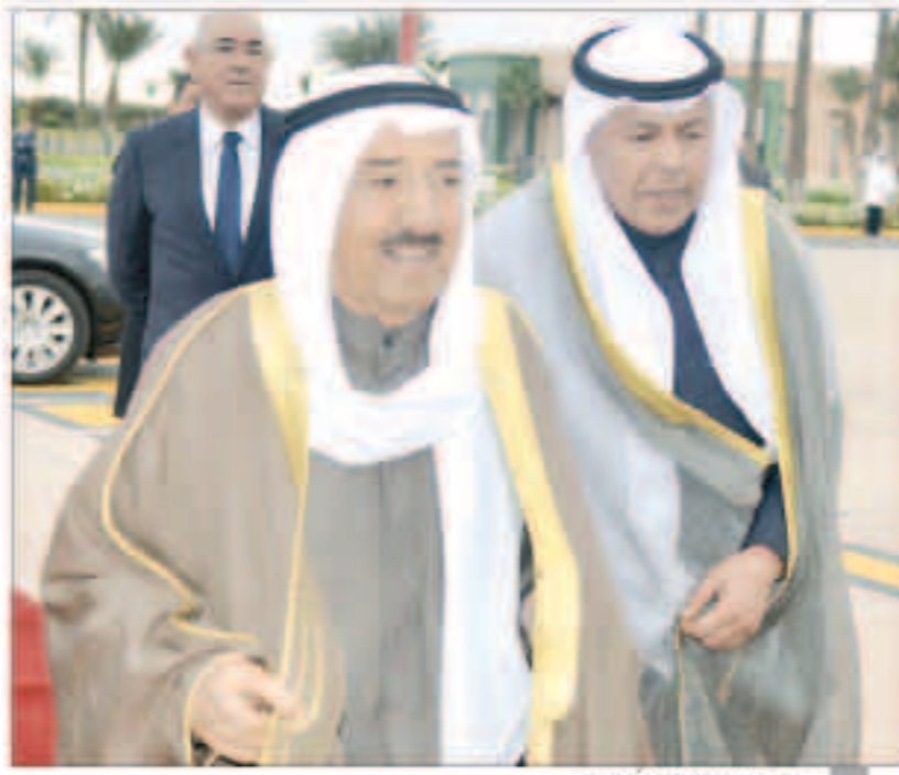
صاحب السمو مغادراً المغرب