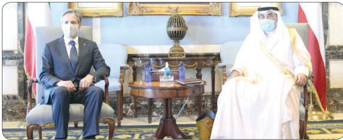
سمو الشيخ صباح الخالد مستقبلا وزير الخارجية الأمريكي

استقبل سمو الشيخ صباح الخالد رئيس مجلس الوزراء وبحضور وزير الخارجية وزير الدولة لشؤون مجلس الوزراء الشيخ الدكتور أحمد الناصر في قصر السيف أمس وزير خارجية الولايات المتحدة الأمريكية الصديقة أنتوني بلينكن والوفد المرافق له وذلك بمناسبة زيارته للبلاد. حضر المقابلة رئيس ديوان سمو رئيس مجلس الوزراء عبدالعزيز الدخيل ومساعد وزير الخارجية لشؤون الأمريكتين حمد سليمان المشعان.