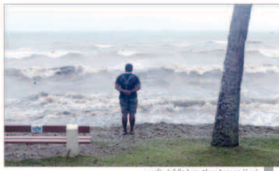
تم بلع من حديث موجات بحرية عالية «سوناامي»

«سكاى نيوز عربية» : وقع زلزال مدمر بلغت قوته 7 درجات، أمس، قرب جزيرة فانواتو في المحيط الهادي دون الإبلاغ عن خسائر في الأرواح أو موجات مد عالية «سوناامي». وأوضح هيئة المسح الجيولوجيا الأمريكية في بيان أن الزلزال وقع على بعد 191 كيلومتراً شمال غرب الجزيرة. وكان زلزال آخر ضرب قرب الجزيرة الأحد الماضي، ووصلت قوته إلى 7.2 درجات، وصدرت تحذيرات من حدوث موجات «سوناامي». و«سوناامي» دولته تبلغ مساحتها 12 ألف كيلومتر مربع، ولا يتجاوز عدد سكانها 250 ألف نسمة.