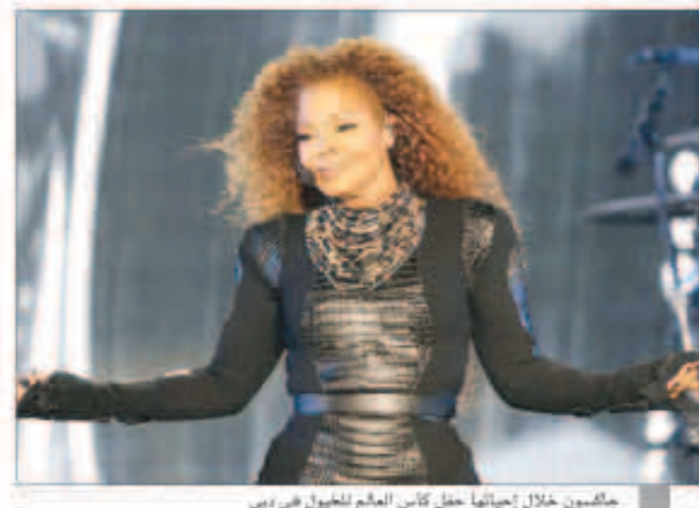
جackson خلال إحيائها حفل كأس العالم للخيول في دبي

«سكاى نيوز عربية» : أعلنت مغنية البوب الأمريكية جانيت جاكسون، أول أمس، أنها ستعلق مؤقتاً جولتها العالمية، بسبب «تغيرات مفاجئة» لتتخطب منها، ومن زوجها، الإتهام للأسرة، في إشارة منها إلى أنها قد تكون حاملاً. وقالت جاكسون، شقيقة نجم الجوب الراحل مايكل جاكسون، خلال مقطع فيديو نشرته على موقع «يوتيوب» : «زوجي وأنا نتخطب للأسرة لذلك أنا مضطرة لتأجيل الجولة، معذرة أرجو أن تفهموا مدى أهمية ذلك بالنسبة لي الآن، على أن استريح كما نصحني الطبيب». وأضافت أنها لم تنس عشاقها وسنواصل الجولة العالمية في أقرب وقت ممكن، وفقاً ما أوردت وكالة «رويترز». كما أعربت عن شكرها للراقصين في فرقها، وبقية أفراد الطاقم وعشاقها على حبهم ودعمهم لها. وأجبت جاكسون آخر حفل لها في نهاية مارس الماضي في إمارة دبي، ضمن احتفالات نسخة الـ 21 لكأس دبي العالمي للخيول.