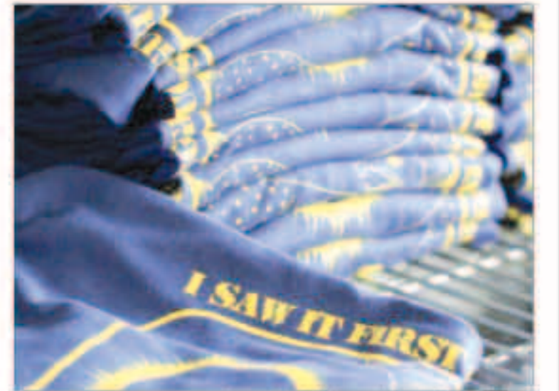
مدينة ديبو باي استعدت لأول كسوف شمسي كلي

وقالت «هذا المجتمع يتعرف على مواجهة كارثة كبرى منذ أعوام عديدة والكثير من استعدادات استقبال الكسوف تعائل في بعض الأوجه استعدادات الكوارث... نعلم ما اعتدنا على فعله ونأمل أن تكون جميعاً مستعدين».