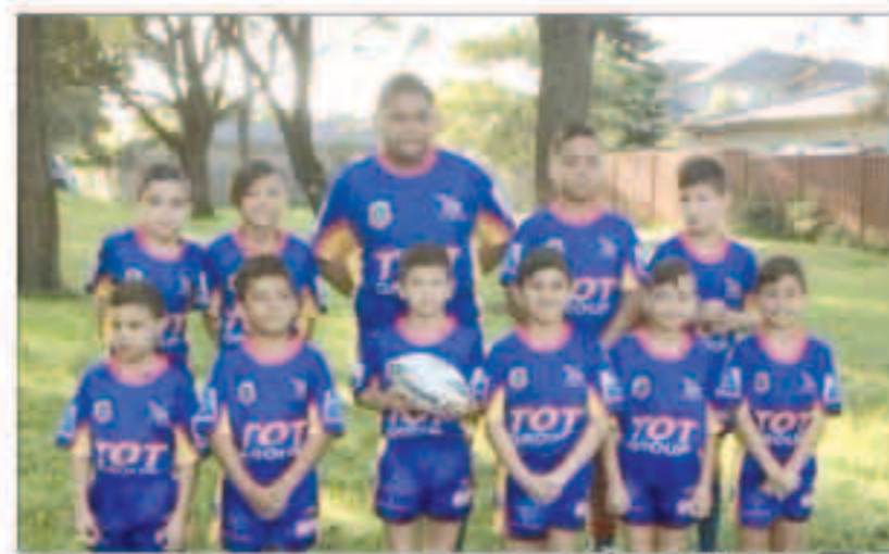
الطفل العملاق متوسماً لفرانك

وتم نشر الفيديو في الأصل من قبل والد فاكاً، لإظهار مهاراته في رياضة الركني، لكنه حظي بشعبية كبيرة لسبب آخر، حيث أثار طول وحجم الطفل جدلاً كبيراً على مواقع التواصل الاجتماعي، وطالب البعض بنقله إلى فريق من فئة عمرية أكبر، لأن حجمه يمنحه ميزة واضحة على منافسيه، وفي نفس الوقت، يمكن أن يتسبب بآذى كبير للأطفال الآخرين.