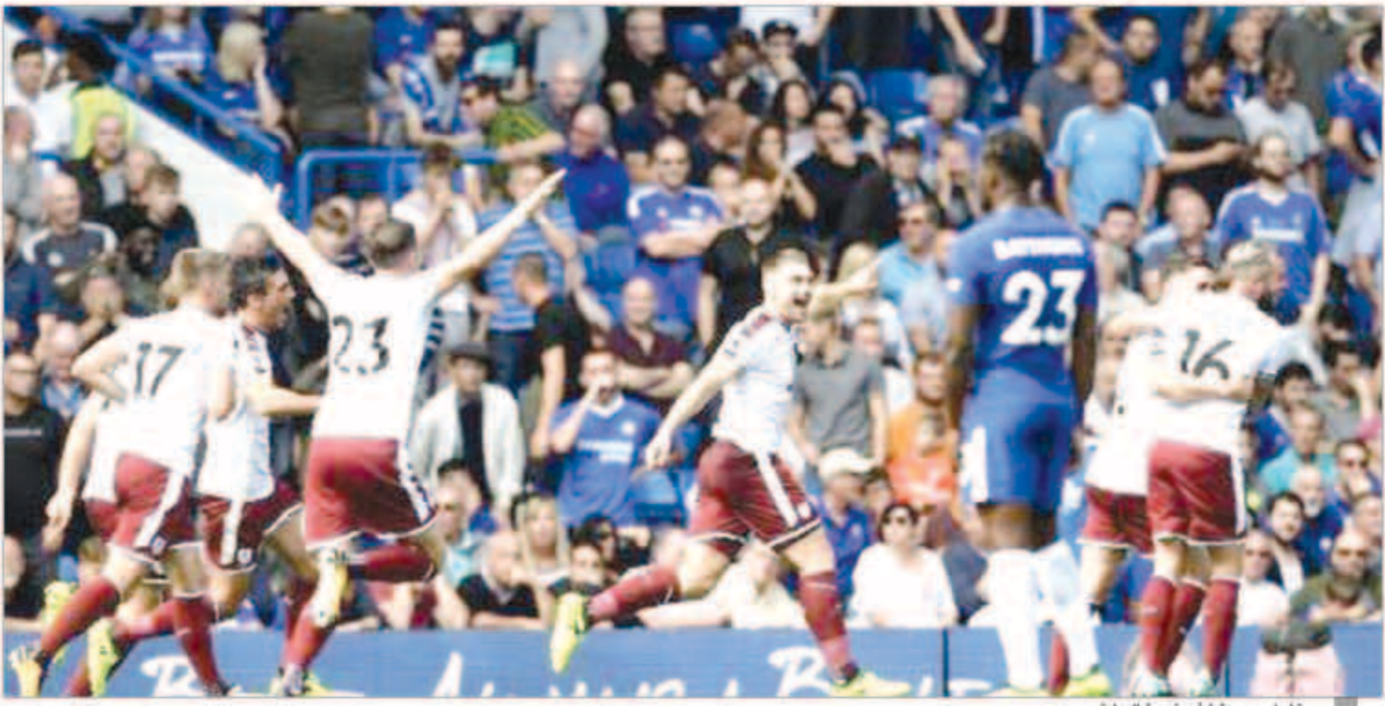
تشيلسي يسقط في ضربة البداية

سقط تشيلسي، حامل لقب، أمام ضيفه بيرتلي (3-2) على ملعب "ستامفورد بريج" بالجولة الافتتاحية للدوري الإنجليزي. وشهد اللقاء طرد لاعبين من تشيلسي؛ بسبب التدخلات العنيفة، حيث خرج حجازي كاهيل مطروفاً في الدقيقة (14)، وإسباني سيك فابريغاس في الدقيقة (81). سجل أهداف بيرتلي كل من سام فوكس "هدفين" في الدقيقتين (3-4)، وستيفن وارد (39)، فيما سجل هدف تشيلسي الفارق مورانا في الدقيقة (69)، ودافيد لويز (88). دخل تشيلسي بخطله المعتادة (3-4)، إلا أنه بدأ متأثراً بشدة من غياب العديد من نجومه مثل إدين هازارد، ويميرو رودريجيز، وباكايوكو، وفيلكس موريس، فضلاً عن غياب ديفيو كوستا. وفضل أنطونيو كوني، مدرب البلوز الدفع ببيانشو على حساب مورانا الذي جلس على مقاعد البدلاء.