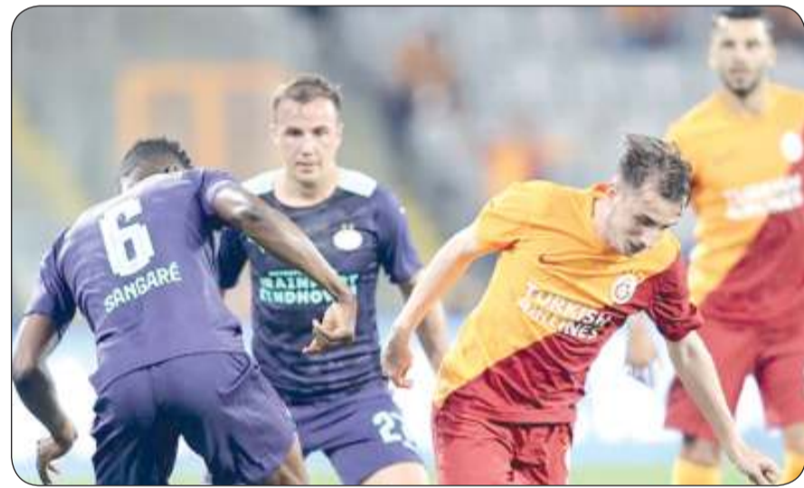
جانب من المباراة

الأشكبرت الأرميني، بعدما سبق له الفوز 1-0 على منافسه ذهابا. كما تاهل لودوجوريتس