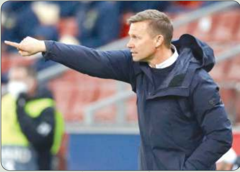
الأمريكي جيسي مارش

وبرابان بروبي. وقال مارش: "سيكون من الجيد أن نمتلك أربعة مهاجمين لملء أي فراغ. أعتقد أنني سأجد حلا، وبعد أن أصبح مسوحا لنا بالقيام بخمسة تبديلات سنحتاج للبدلاء والجميع سيحصل على فرصة". وتحدث مارش مع قائد الفريق مارسيل سيبتز كثيرا مؤخرا، حيث لا زال لدى الأخير عاما في عقده مع الفريق، ولا يبدو أنه يعارض فكرة اللعب لفريق آخر. وأوضح مارش: "الأمر ليس سهلا بالنسبة لأي لاعب يتبقى عام في عقده، لدي علاقة جيدة معه (سيبتز)، مثلما كانت علاقته بالمدرّب السابق جوليان ناغلسمان في العامين الماضيين". وأضاف: "أنا شخص جيد ويفعل كل ما لديه من أجل الفريق، سنرى كل شيء".