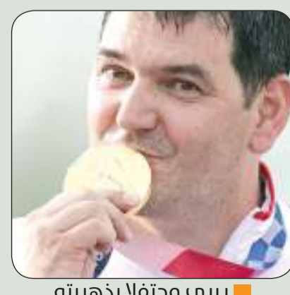
بيري محتفلا بذهبيته

سيطرت التشيك على الميداليتين الذهبية والفضية لمنافسات الرماية من الحفرة (تراب) للرجال ضمن فعاليات أولمبياد طوكيو 2020 أمس الخميس. وتوج التشيكي بييري لبيتاك بالميدالية الذهبية فيما حصد مواطنه ديفيد كوستليسكي الميدالية الفضية، وذهبت الميدالية البرونزية إلى البريطاني ماثيو كوارد هولي. وأصاب لبيتاك وكوستليسكي 43 هدفا ليقسما الرقم القياسي الأولمبي الجديد، فيما أصاب كوارد هولي 33 هدفا.