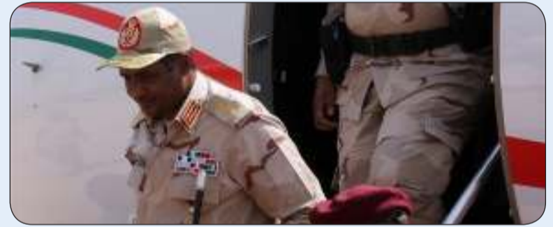
نائب رئيس مجلس السيادة السوداني محمد حمدان دقلو

«وكالات»: توجه نائب رئيس مجلس السيادة السوداني محمد حمدان دقلو إلى موسكو أمس الأربعاء في زيارة رسمية يرافقه فيها عدد من وزراء الحكومة، حسب ما أعلن المجلس في بيان. وفي العام الماضي، أعلنت السلطات السودانية أنها ستدرس من جديد الاتفاق مع روسيا لتضمينه بنوداً قاعدية بحرية روسية في السودان، بعد اتفاق عليها في عهد الرئيس السابق عمر البشير. وأكد مسؤول عسكري سوداني رفيع المستوى يومها أن بلاده بصدد مراجعة الاتفاق مع روسيا لتضمينه بنوداً تعتبر «ضارة»، إلا أن رئيس مجلس السيادة وقائد الجيش السوداني عبد الفتاح البرهان أكد في نوفمبر أن الاتفاق لم يُلغ.