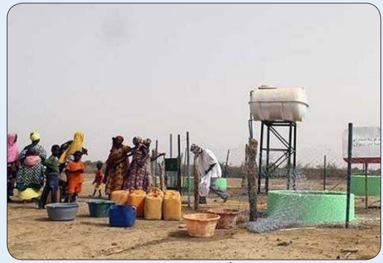
مقربون أمام خزان ماء في موريتانيا

«وكالات»: توقع تقرير أن يواجه أكثر من 660 ألف شخص في موريتانيا، 15 في المئة من السكان، أزمة غذائية بين يونيو وأغسطس المقبلين، بزيادة 38 في المئة مقارنة مع 2021.