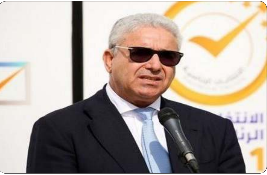
رئيس الوزراء المكلف من مجلس النواب الليبي فتحي باشاغا

مساعدى البرلمان الليبي لتعيين حكومة جديدة برئاسة باشاغا. وأضاف الديبية قائلًا «لن أقبل باي شكل من الأشكال تسليم السلطة للفوضى، والانتخابات هي الحل الوحيد».