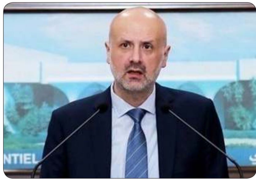
وزير الداخلية اللبناني بسام مولوي

وطالب «المسؤولين المعنيين بالعمل على إيجاد الحلول الناجعة بسرعة فائقة، منعاً لأزمة رغيف، خصوصاً وأن تسليمات الطحين إلى المخابزين والأفران بالكاد تسد الحاجة اليومية لإنتاج الرغيف».