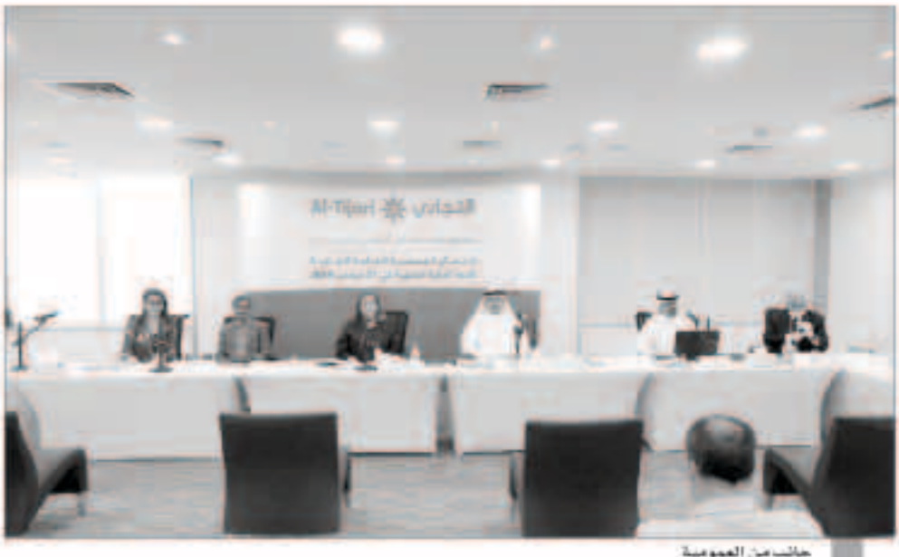
جانب من العمومية

وكذلك ارتفعت إيرادات الفوائد بنسبة 3.6% وارتفعت إيرادات الرسوم والعمولات بنسبة 4.2% استشراف المستقبل وفي حديثه عن المستقبل وتطلعات البنك المستقبلية قال الشيخ أحمد الصباح « إن التزام البنك التجاري الكويتي بمعايير الأداء المصرفي المتميزة يأتي انطلاقاً من قيمنا الأساسية بأن اتباع أسلوب الأداء الصحيح واللائم - وحتى وإن لم يكن هو الخيار الأسهل - إلا أنه يساهم دائماً في تعزيز ولاء العملاء لحسرتنا. وقد قمنا بتحديث أولويات العمل التي ينعين الالتزام بها بما يضع خدمة عملائنا على النحو الأفضل في بؤرة اهتمامنا. ونحن نؤمن أن عملاتنا وجمع المتعاملين مع مصرفنا على ثقة تامة بقدرتنا على اتخاذ القرارات والقيام بالإجراءات اللازمة للمتعامل مع كافة المتغيرات التي يشهدها القطاع المصرفي». وفي الختام أشاد الشيخ أحمد الصباح بكفاءة الجهود المبذولة من قبل فريق الإدارة التنفيذية وجميع موظفي البنك من أجل الإهتمام بالعملاء والتقدير لكافة السلطات الرقابية والاختصاصات الكوينة المركزي على جهود الحشنة الرامية إلى تحسين الجهاز المصرفي والمالي في دولة الكويت.