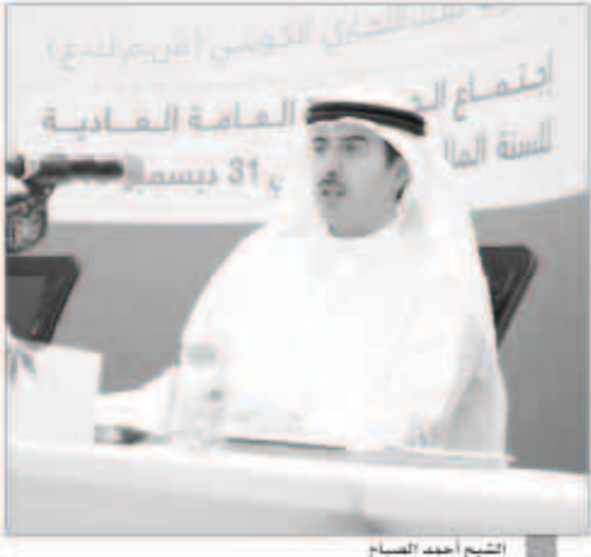
الشيخ أحمد الصباح