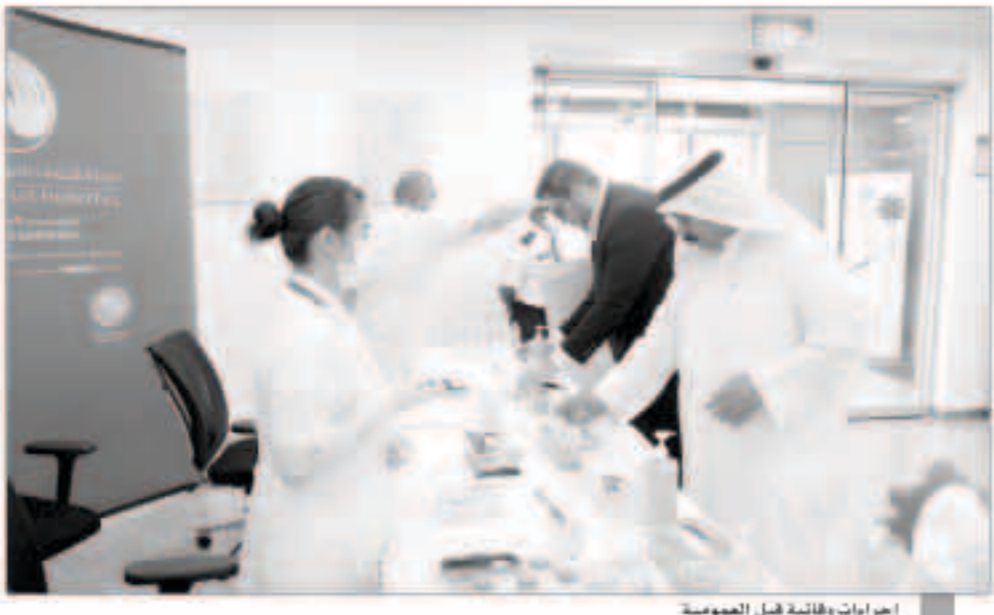
اجراءات وإقانة قبل العمومية