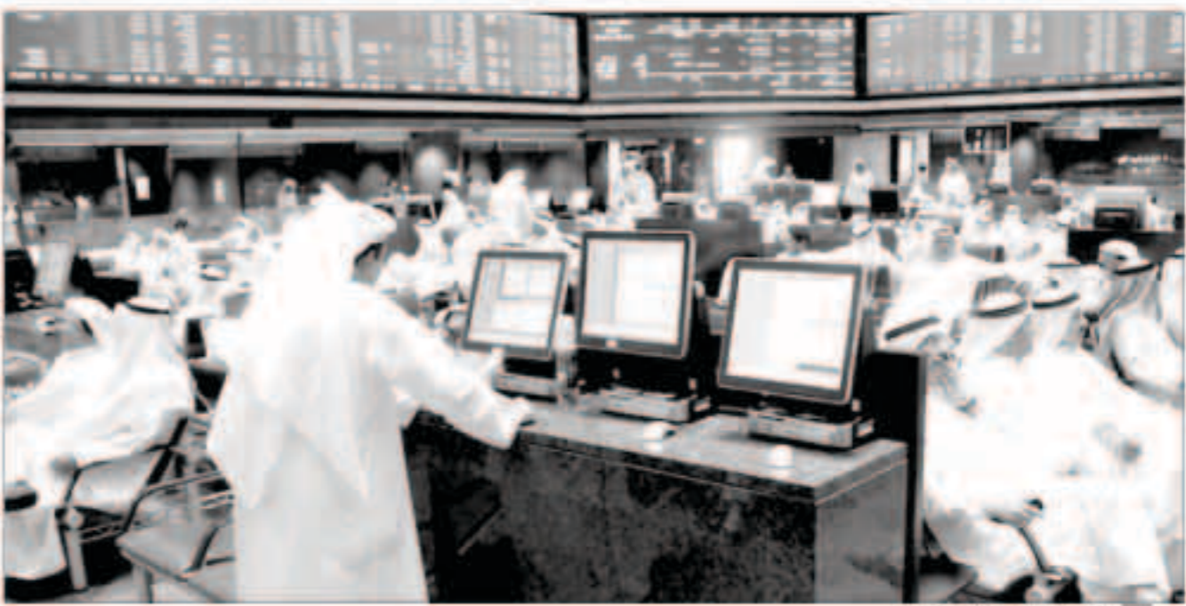
أسبوع إيجابي لخبرات البورصة

ارتفعت المؤشرات الكوبيتية بشكل جماعي في ختام تعاملات أسبوع الخميس، حيث سجل السعري نمواً بمعدل 0.11% عند مستوى 5284.87 نقطة رابحاً 6 نقاط. وارتفع مؤشر الوزني عند الإغلاق 0.27% بعد صعوده إلى مستوى 367.53 نقطة رابحاً قرابة النقطة. كما ارتفع مؤشر كويت 15 في نهاية الجلسة 0.39% بإقفاله عند مستوى 871.7 نقطة رابحاً 3.41 نقطة. وكان الأداء متبايناً في سبيل تعاملات أسبوع، حيث تراجع السعري بشكل طفيف، فيما ارتفع مؤشر الوزني ومؤشر كويت 15. وتراجعت وتيرة التداولات أسبوعياً، حيث انخفضت الكميات 4.7% إلى 152.61 مليون سهم، مقابل 160.17 مليون سهم بالأسبوع الأول.